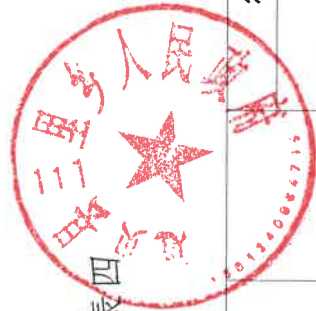
进贤县三里乡人民政府 2023年度行政强制实施情况统计表