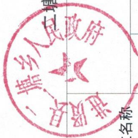
二塘乡(政府、部门) 2023年度行政处罚实施情况统计表