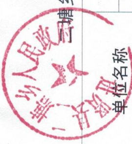
云塘乡(政府、部门) 2023年度行政许可实施情况统计表